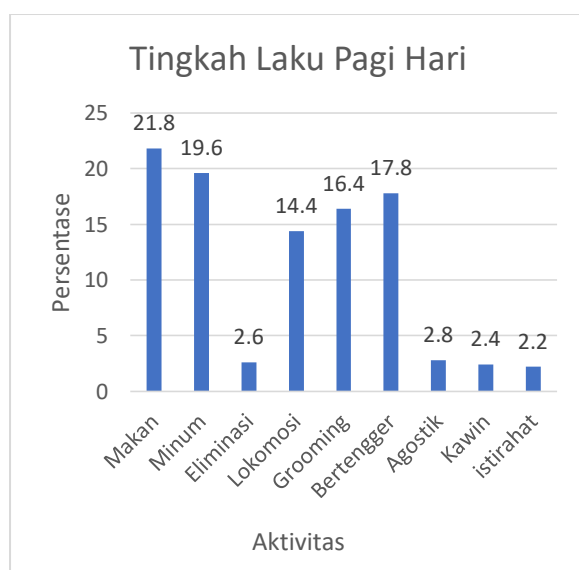
Ilustrasi 1. Persentase aktivitas ayam selama pengamatan.

Tingkah laku ternak merupakan ekspresi suatu binatang yang disebabkan oleh semua faktor yang mempengaruhinya modifikasi. Aktivitas ayam KUB yang diamati terdiri dari dua macam, yaitu aktivitas yang berhubungan langsung dengan aktivitas makan (makan, minum, BAB, dan bertenger) dan aktivitas yang memengaruhi aktivitas makan (lokomosi, grooming , kawin dan istirahat). Pengamatan 21,8% dilakukan selama 7 hari di waktu pagi dan sore hari. Persentase aktivitas Ayam KUB selama pengamatan pada pagi hari ditunjukkan pada Ilustrasi 1. Pada Ilustrasi 1. memperlihatkan bahwa aktivitas perilaku ayam KUB terbesar adalah aktivitas makan