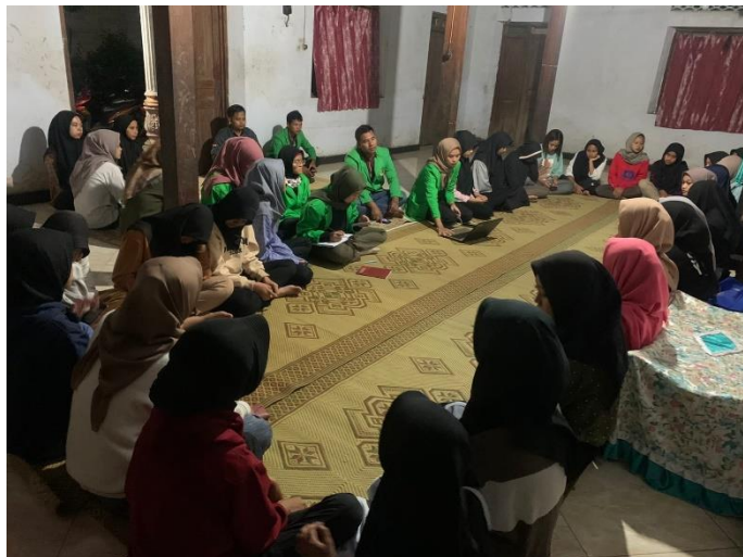
Gambar 2. Sesi Tanya Jawab dengan Peserta Sosialisasi

Pada kegiatan sosialisasi berlangsung peserta sangat antusias dalam menyimak dan menanggapi materi sosialisasi. Sosialisasi diawali dengan pemaparan materi terkait dengan UU ITE dan dilanjutkan dengan sesi tanya jawab. Beberapa pertanyaan yang diajukan peserta yaitu tentang sudut pandang hukum dari menagih hutang melalui sosial media khususnya WhatsApps, barang bukti pada kasus pelanggaran UU-ITE dan kebenaran tentang isu penghapusan pasal pencemaran nama baik dan penghinaan yang tercantum dalam Undang-undang (UU) Informasi dan Transaksi Elektronik (ITE) pasal 27 dan 28.