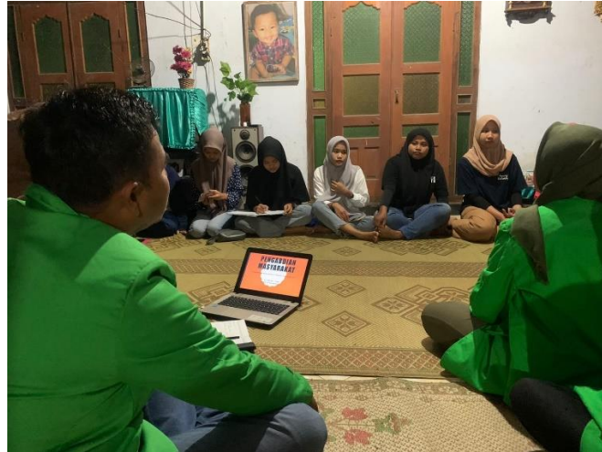
Gambar 1. Penyampaian materi Sosialisasi kepada Pemuda Dusun Suden