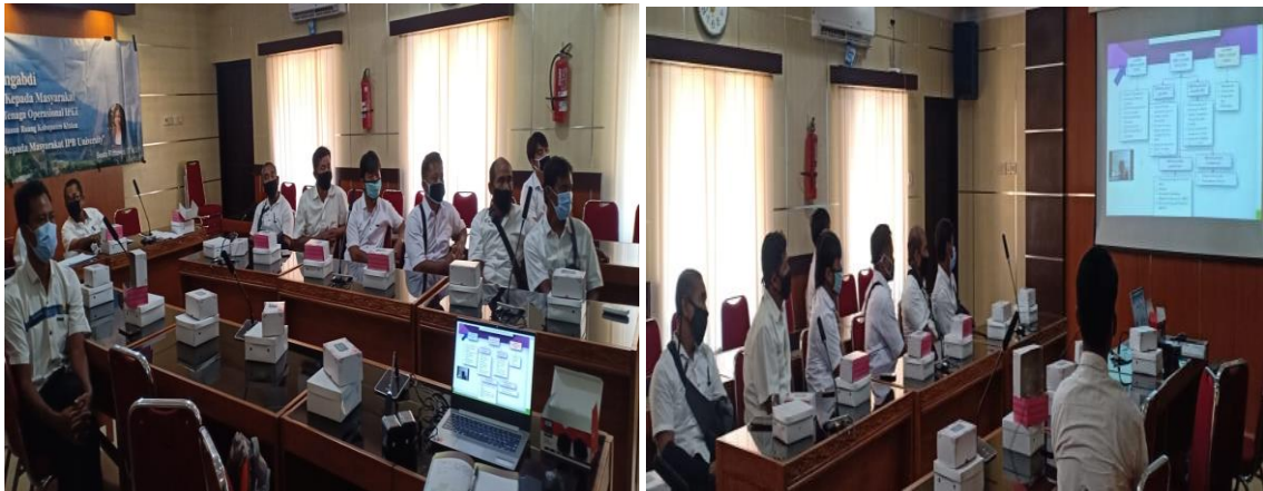
Fig. 2. Kegiatan sosialisasi

Setelah pemaparan peserta diminta mengisi kuisioner untuk menilai pemahaman peserta sosialisasi diperoleh tingkat pemahaman peserta terhadap teknik operasional IPLT 100 % dan operator IPLT akan melaksanakan monitoring IPLT setiap hari terutama untuk membersihkan scum /kotoran pada unit pengolahan.