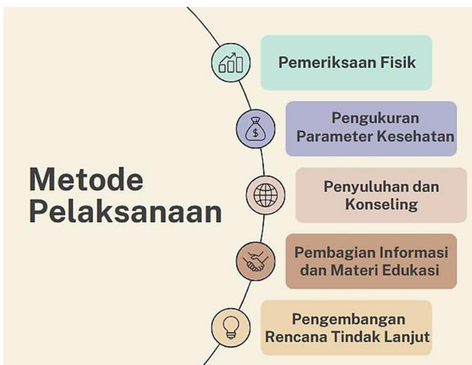
Gambar 1. Metode Pelaksanaan PKM

Dengan kombinasi metode-metode ini, PKM Cek dan Konseling Kesehatan bertujuan untuk memberikan layanan kesehatan yang holistik kepada masyarakat, baik dalam hal pemeriksaan fisik, evaluasi parameter kesehatan, edukasi, maupun rencana tindak lanjut yang sesuai dilakukan. Langkah awal adalah melaksanakan survey awal ke lokasi pengabdian, meminta izin pelaksanaan kegiatan, serta diskusi dengan pemilik panti asuhan tentang rencana kegiatan yang akan dilakukan.