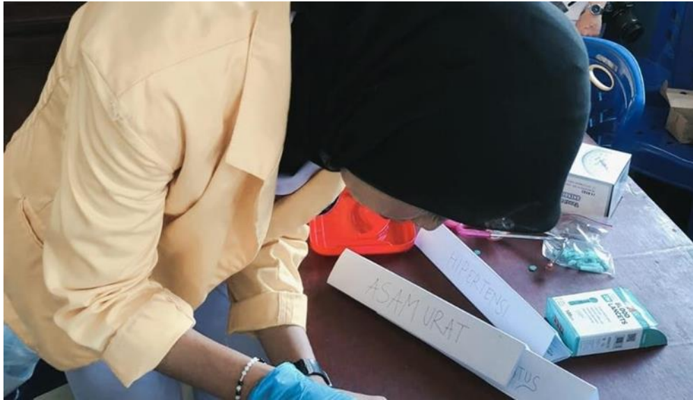
Gambar 4. Dokumentasi Kegiatan