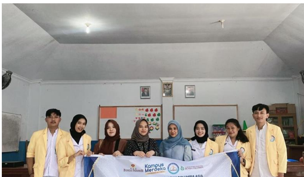
Gambar 3. Dokumentasi Kegiatan