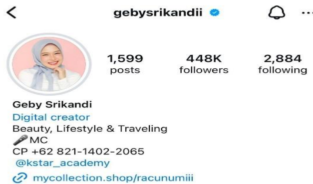
Gambar 4.1 Laman Profil Instagram Geby Srikandi Sumber: Instagram, Diolah oleh peneliti (2024)

Seperti yang tertera, Geby Srikandi membuat berbagai konten dengan fokus pada Beauty, Lifestyle, & Travelling . Selain itu, ia juga menunjukkan bakat yang ia miliki dengan membuat konten mengenai Dance dari berbagai grup musik K-pop. dan sebagai seorang penggemar K-pop, ia juga kerap mempresentasikan dirinya sebagai K-popers dengan membuat berbagai konten menarik mengenai kegiatan fangirling yang ia lakukan.