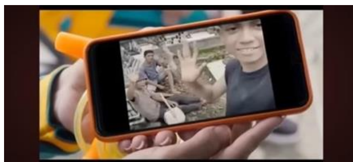
Gambar 7.2 (Menit 58:22)