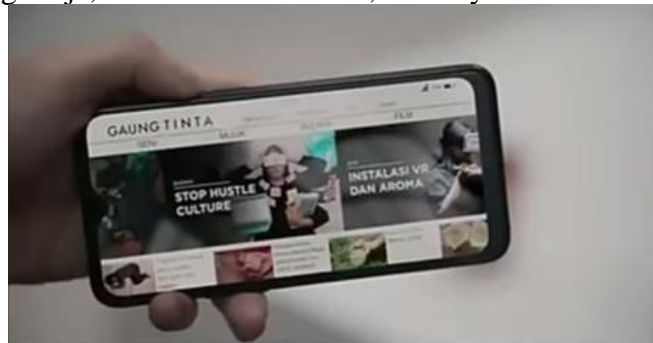
Gambar 3.2 (Menit 03:53)

Dialog: Tapi sekarang kerja, Bu. Di artikel online, namanya GAUNGTINTA.id