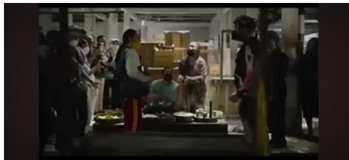
Gambar 4 (Menit 12:22)