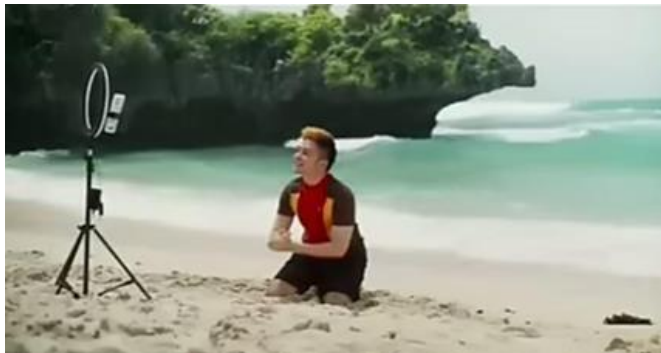
Gambar 2 (Menit 01:58)