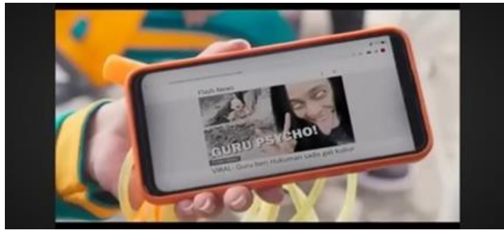
Gambar 7.3 (Menit 58:23)