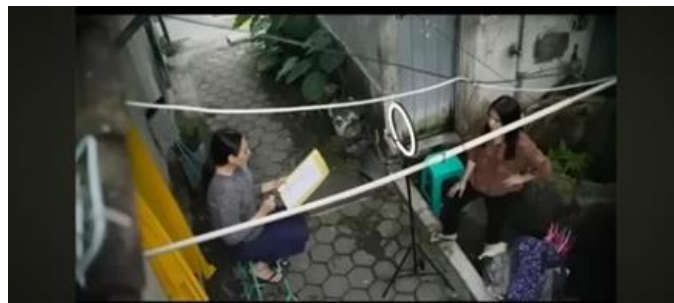
Gambar 6 (Menit 30:05)