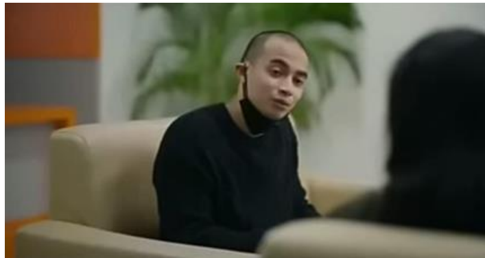
Gambar 3.4 (Menit 04:20)

Dialog : Kamu disini sebagai? Videografer.