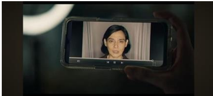
Gambar 9 (Menit 01:12.34)