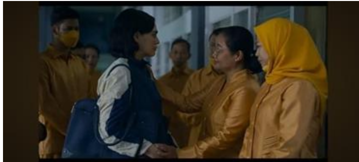
Gambar 10 (Menit 01:39:22)