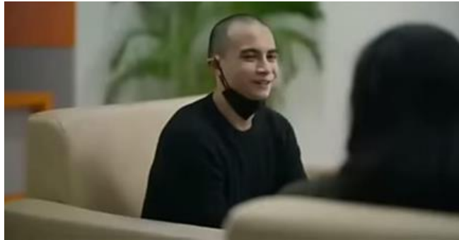
Gambar 3.1 (Menit 03:49)

Dialog: Tapi sekarang kerja, Bu. Di artikel online, namanya GAUNGTINTA.id