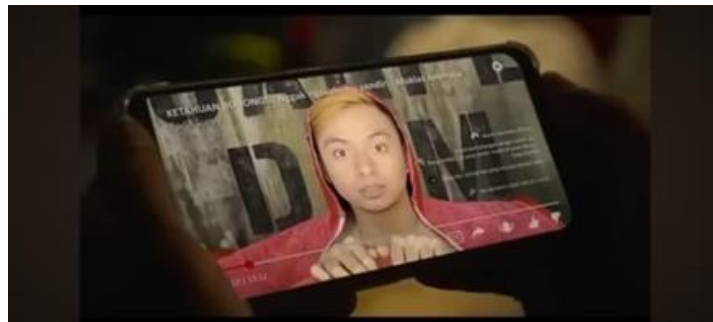
Gambar 8 (Menit 33:24)