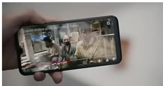
Gambar 3.3 (Menit 03:59)

Dialog: Jadi kita itu ngeliput macam- macam lah, Bu. Dari budaya, seni, film, music.